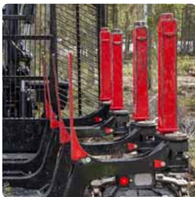
Séparez les grumes à l'aide de barre de séparation (option)